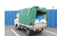
加工場から廃プラごみを収集