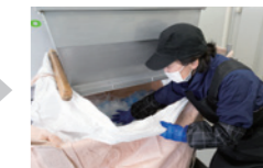
洗浄後は細分され乾燥されたものが出てきます