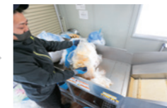
汚れたビニールを分別しながら機械に投入